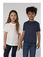
SOL'S REGENT KIDS 11970